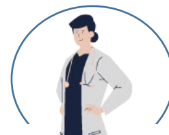
Atención médica preventiva

Mascarilla, alcohol en gel, guantes, desinfectante de zapatos, uso de lentes y control de temperatura al ingresar a las oficinas.