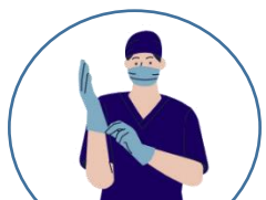
Equipo y productor de protección

Capacidad de oficina para recibir a colaboradores del segmento.