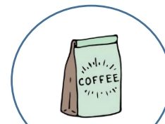
Entrega de paquete de Café

Dos veces por semana se sirve merienda a los colaboradores para levantar defensas del organismo.